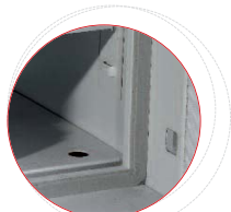
↘ Juntas múltiples para asegurar la estanqueidad en caso de incendio

Stop Fire 900. Con 4 bandejas más una guía en el techo, con soporte para carpetas colgantes, regulables en altura. (5 niveles de carpetas colgantes en total).