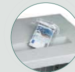
Ranura superior 20x300