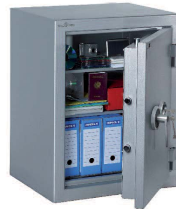
Zephir Duo 1114.