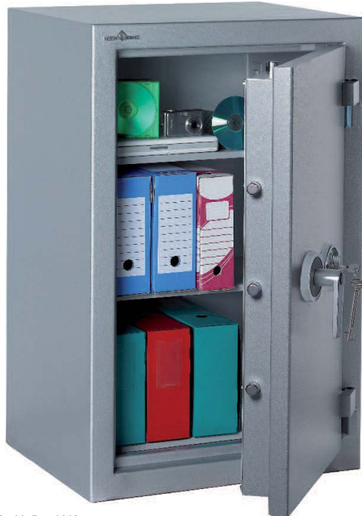
Zephir Duo 1149.