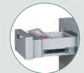
Cajón de depósito certificado grado 1