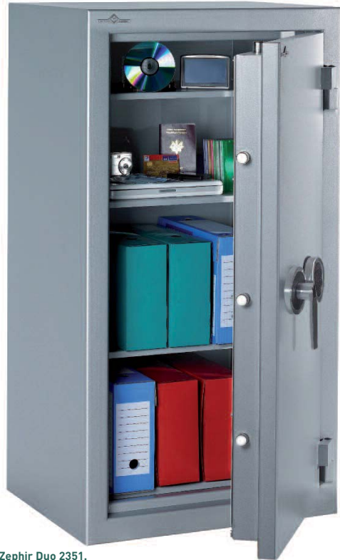
Zephir Duo 2351.