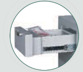
Cajón de depósito certificado grado 2