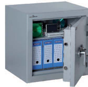
Zephir Duo 2084.