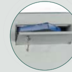
Tolva de depósito