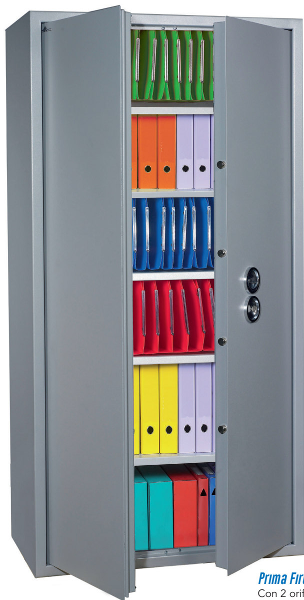
Prima Fire 700.

Con 2 orificios de fijación en la base de \varnothing 14 mm.